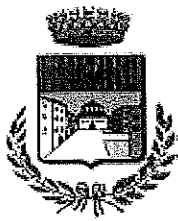
Comune di Piazza al Serchio